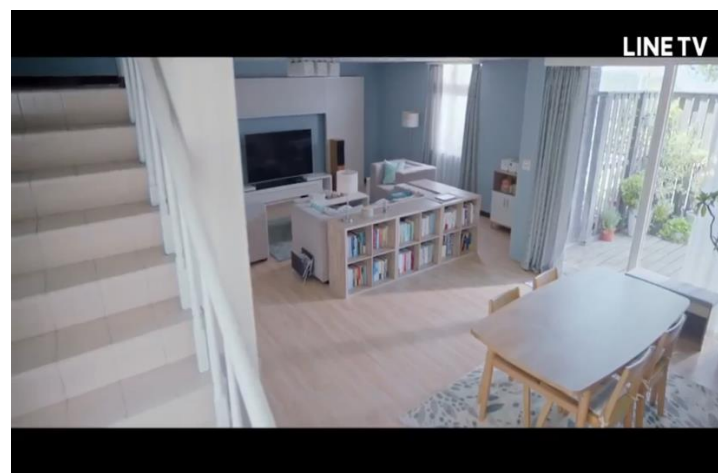
圖五 20 ：《茉莉的最後一天》中的客廳