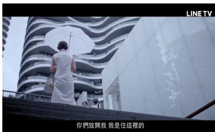
圖十 26 ：《必須過動》在構圖上運用大量的白色