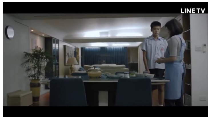
圖四 19 ：《媽媽的遙控器》中的客廳

畫面的布景缺乏平凡生活、有溫度的氣息，營造與現實脫離的氛圍和未來感 18 。以親子互動最常發生的客廳為例，《媽媽的遙控器》、《茉莉的最後一天》及《必須過動》中的客廳寬敞且裝潢極簡奢華，帶來冰冷疏離的感受（圖四）（圖五）（圖六），《貓的孩子》中的客廳狹小且物件繁雜，光線幽暗，具有詭異、令人不安的神祕感（圖七）。《孔雀》中的客廳則以飽和度高的鮮明色牆、帶有俗麗花色的裝潢呈現不和諧的怪誕氛圍（圖八）。