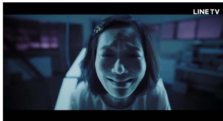
圖三 17 ：茉莉媽媽看見死去的茉莉出現時的模樣