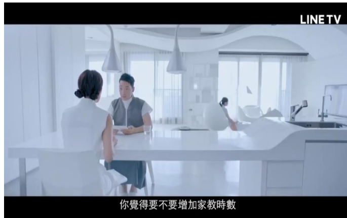
圖六 21 ：《必須過動》中的客廳