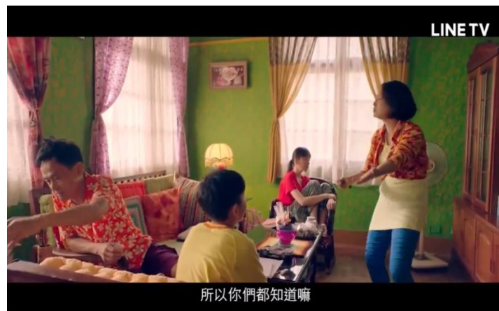
圖八 23 ：《孔雀》中的客廳