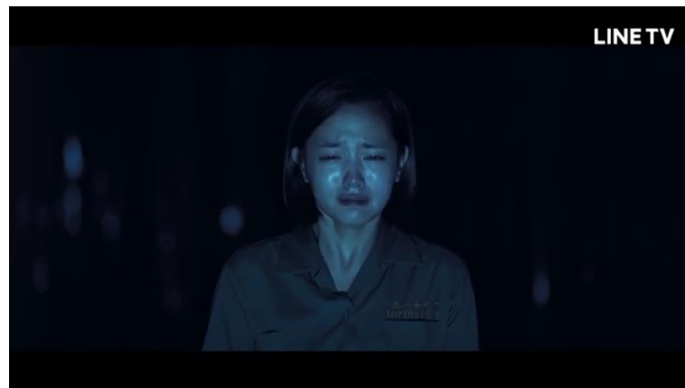
圖二 16 ：死去的茉莉出現