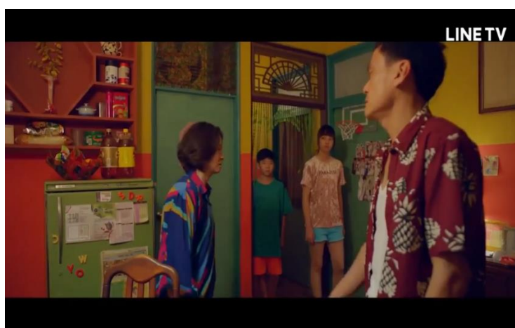
圖九 25 ：《孔雀》在構圖上多運用鮮明的顏色和俗艷的圖案

此劇在構圖上以不設置視覺焦點為原則，讓觀眾關注詭譎的劇情發展 24 ，不過在《孔雀》與《必須過動》中的美術設計與用色帶有特殊的含義，以視覺使奇幻感與科幻感更加濃烈。《孔雀》中巧藝一家的服裝及居家裝潢在構圖上多運用飽和度高、對比的顏色與俗艷的圖案（圖九），營造不和諧的氛圍，呼應孔雀羽毛的華麗，並象徵巧藝一家迎合主流社會價值、不切實際的慾望，以及不惜代價追逐慾望的荒誕。《必須過動》中的社會是個科技發達且集權的反烏托邦，和平只是個假象，根據不同的階級與身分有不同規定的裝扮，例如住在都心好宅的媽媽身著白色長裙、頭綁兩個向下的包子頭，而劇中都心好宅家庭空間的布置、人物裝扮都運用了大量代表高貴、和平與科技的白色（圖十），象徵虛偽表面的和平以及冰冷的高科技。